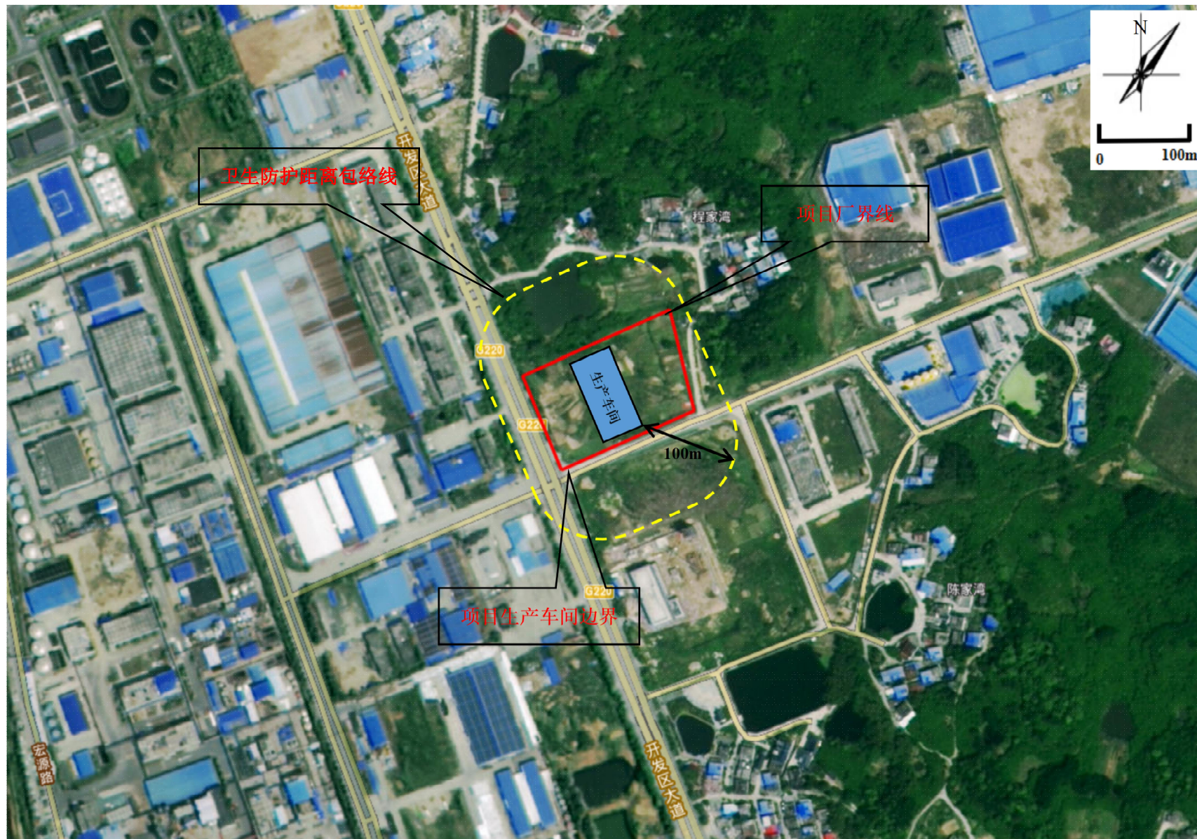
附图 5 项目卫生防护距离包络线图