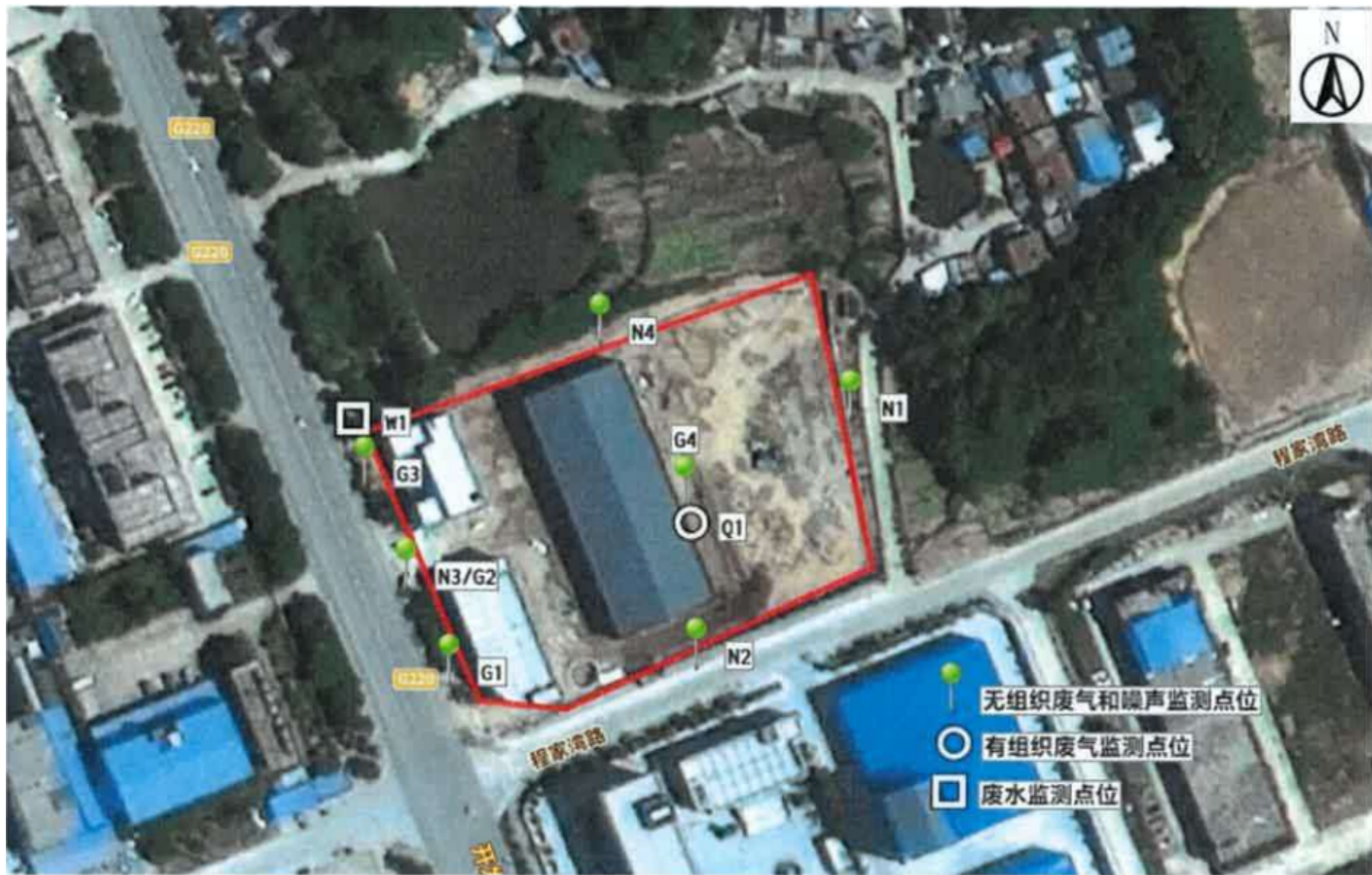
附图 4 项目验收监测点位示意图