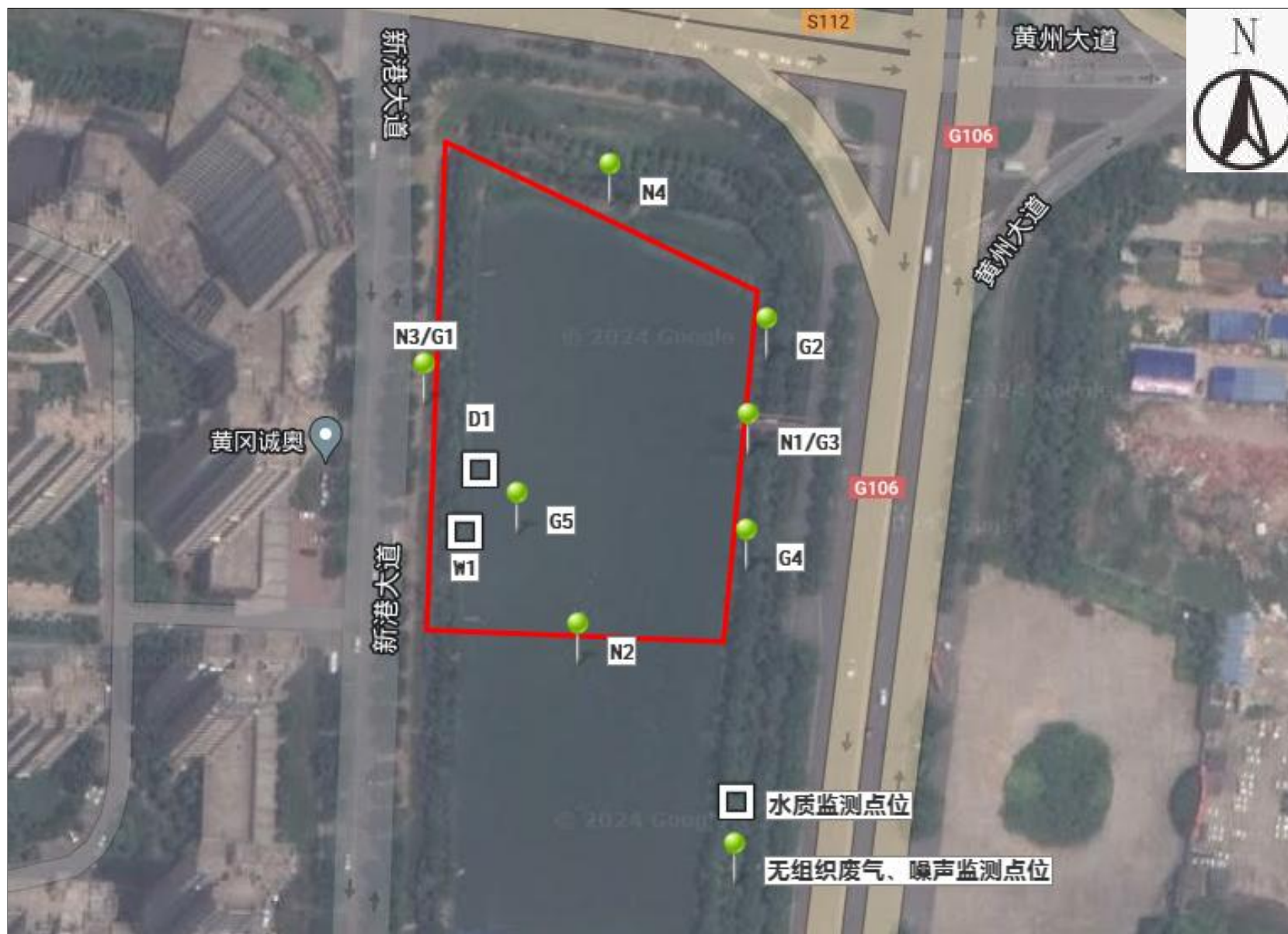
附图 4 项目监测点位图