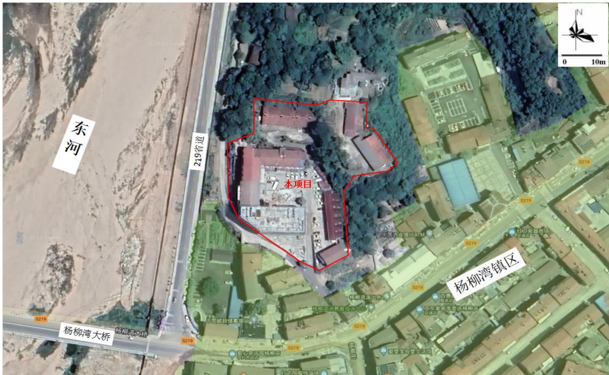
附图2 项目周边环境关系示意图