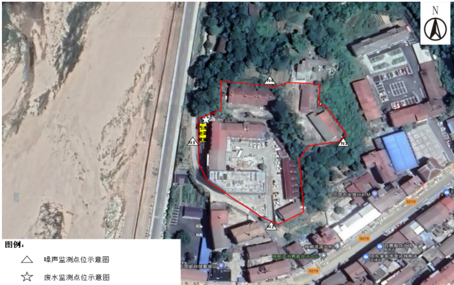
附图3 项目验收监测点位图