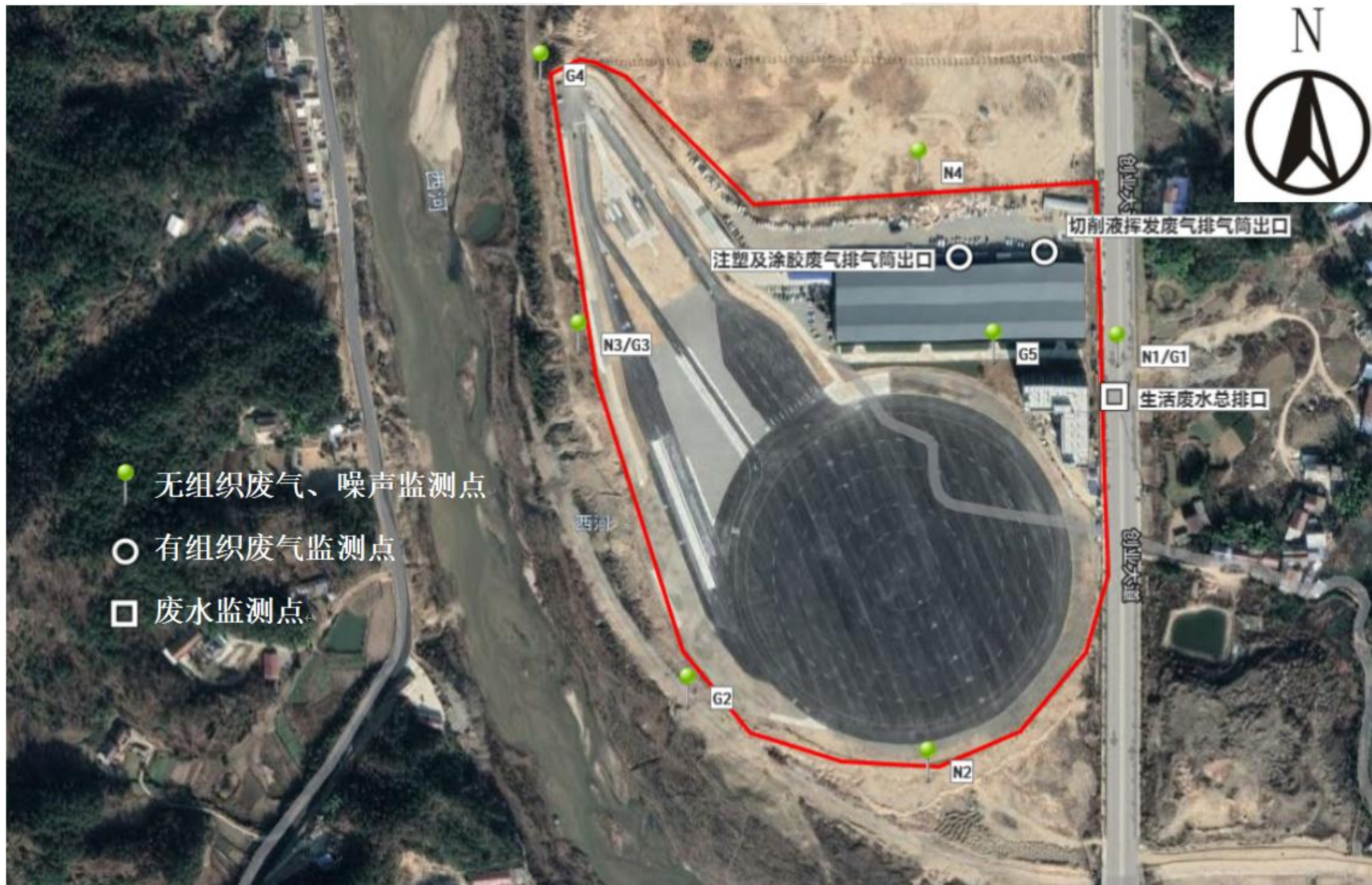
附图5 项目验收监测点位图