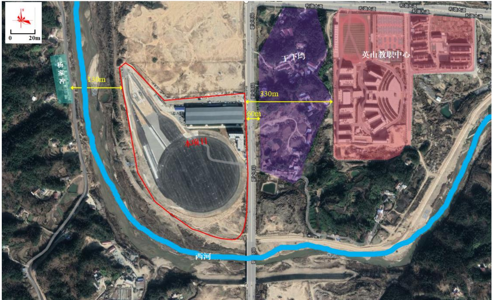
附图2 项目周边环境关系示意图