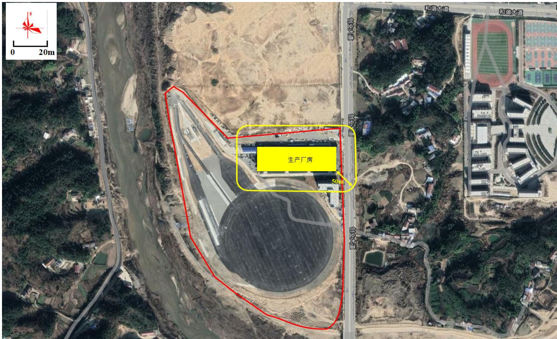
附图 6 项目卫生防护距离包络线图