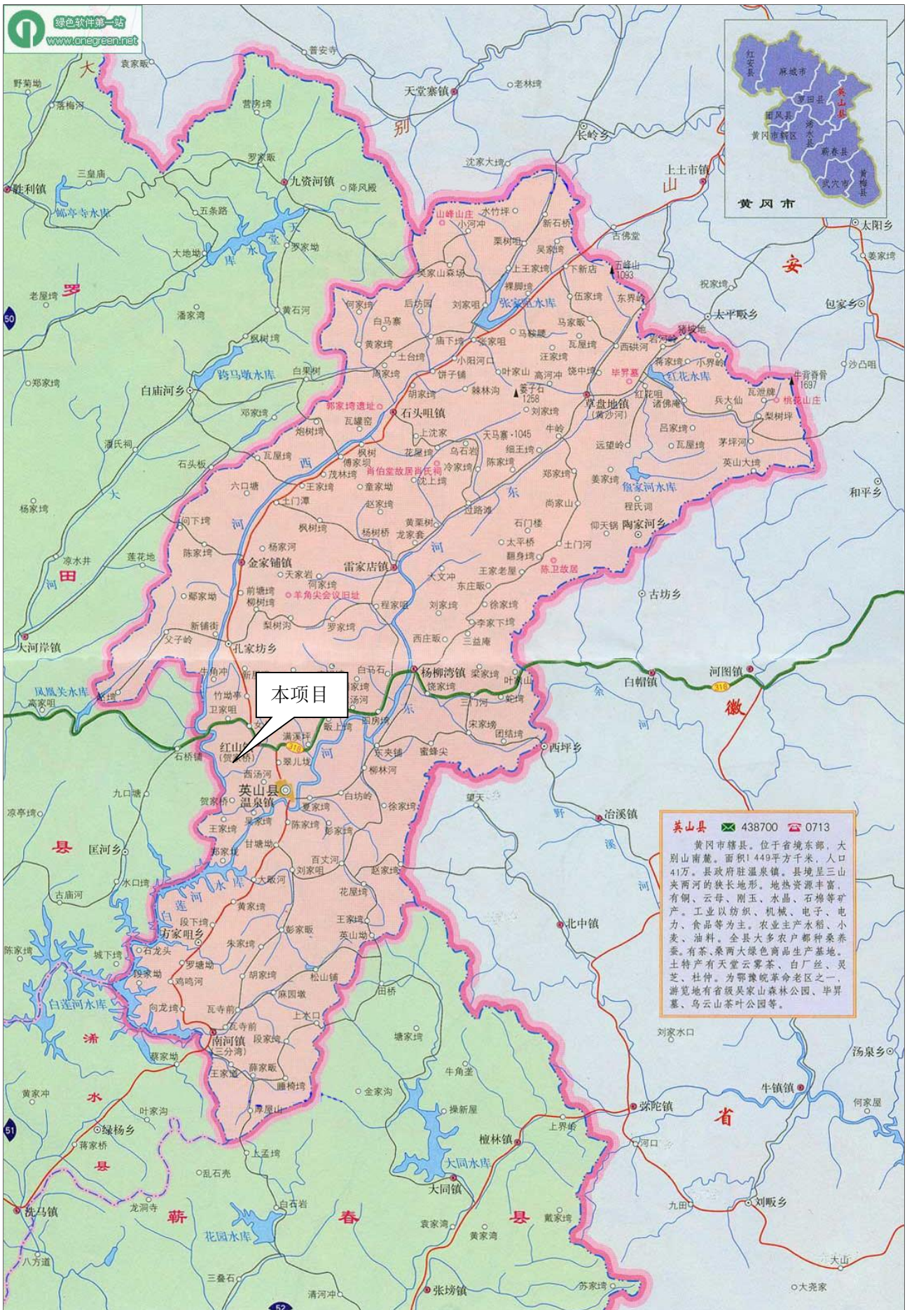
附图1 项目地理位置示意图