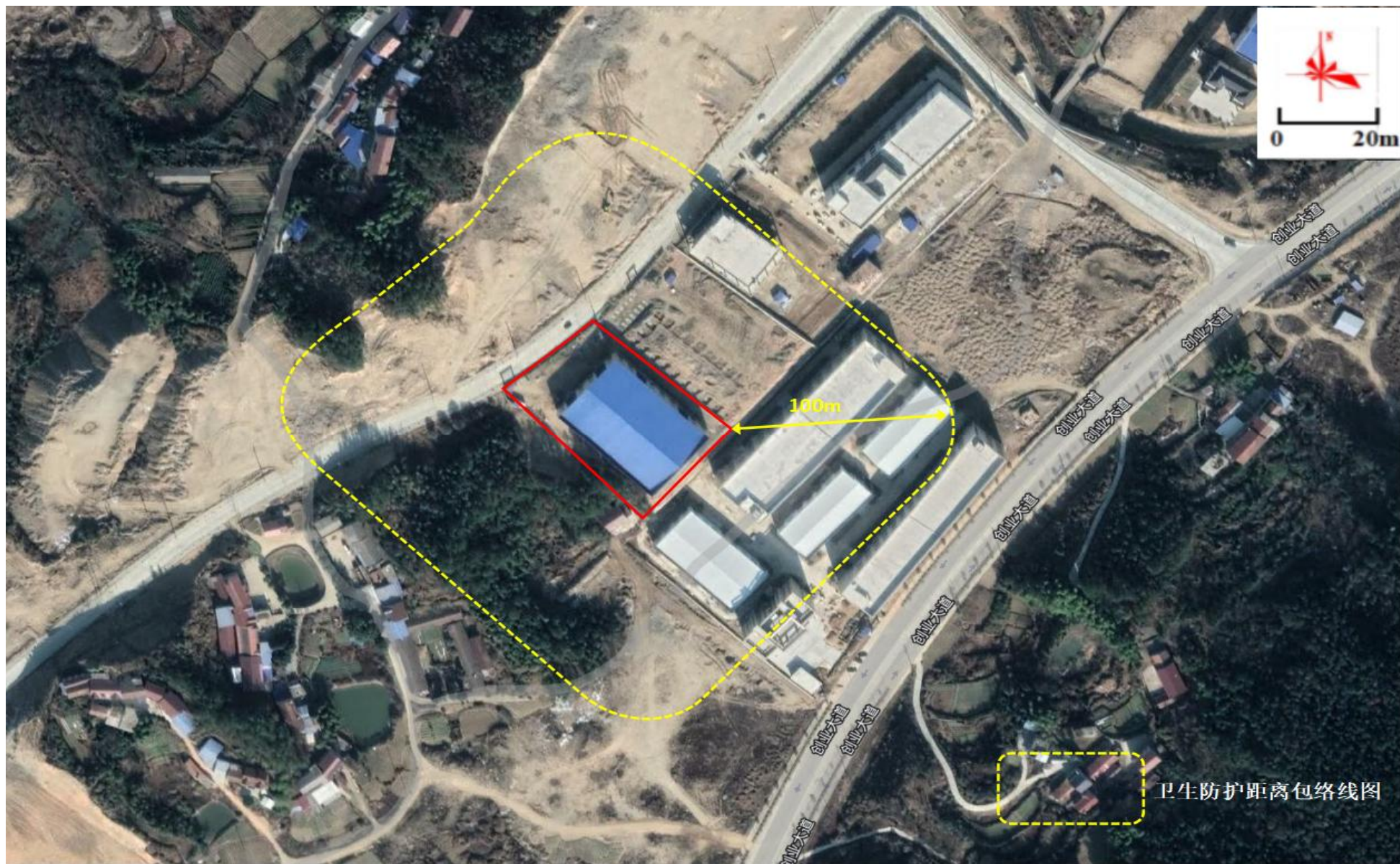
附图 5 项目卫生防护距离包络线图