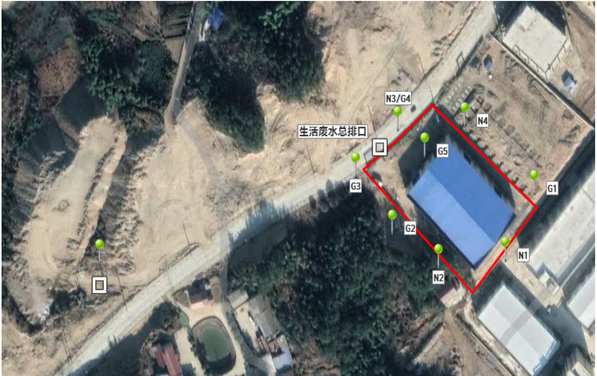
附图 4 项目验收监测点位图