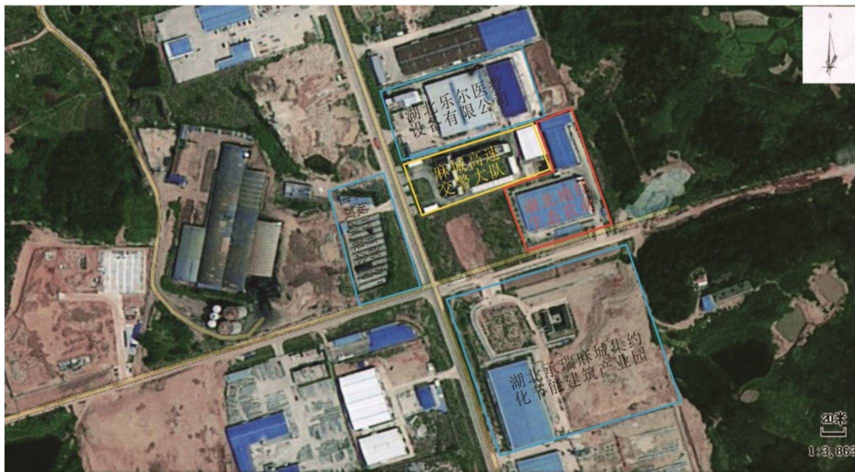
附图 2 项目周边环境示意图