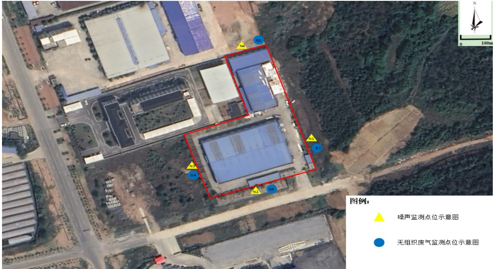
附图 4 验收监测点位示意图