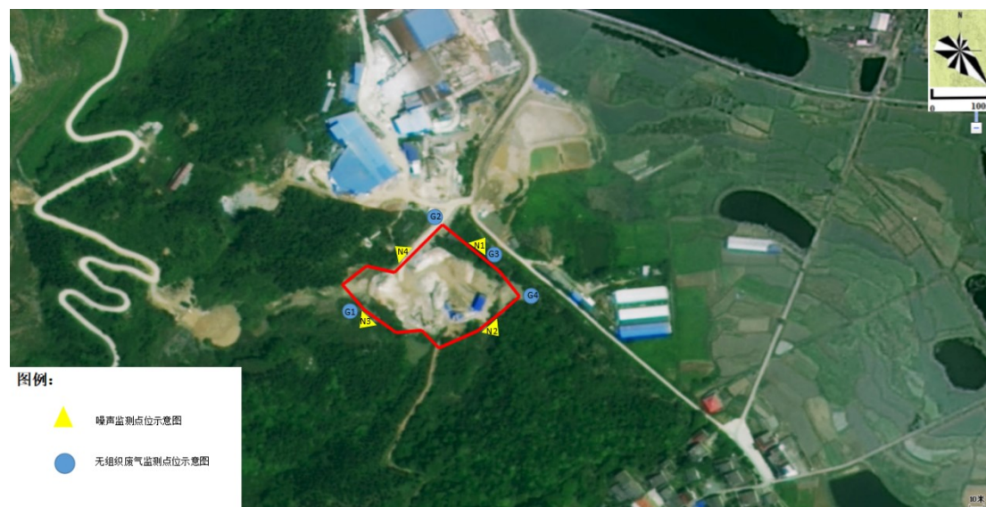
图4-1 本项目验收监测点位图